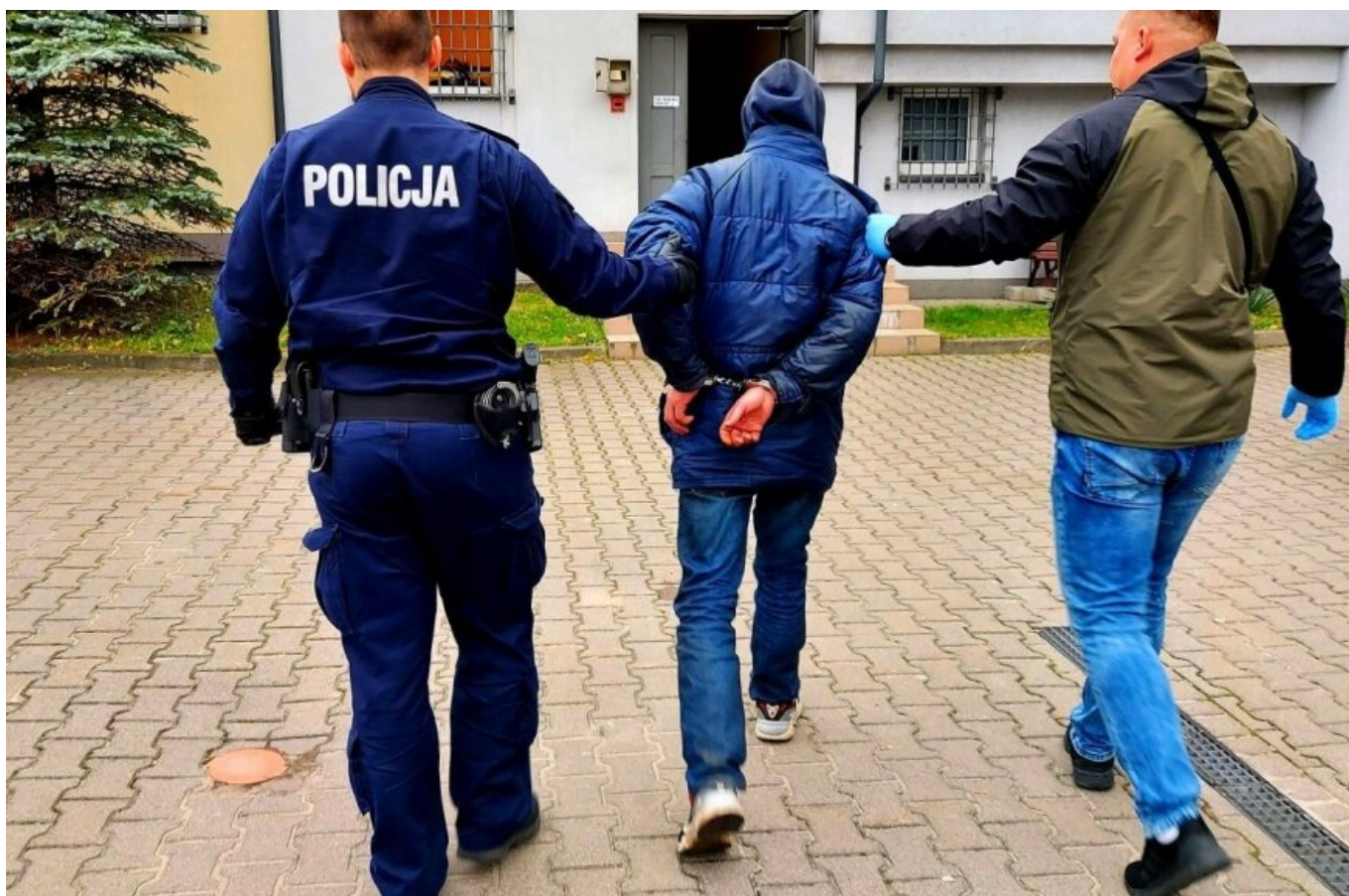
Rawscy policjanci zatrzymali dwóch mężczyzn w wieku 50 i 68 lat podejrzanych o kradzież

data aktualizacji: 2021.11.02 autor: Włodzimierz Szczepański